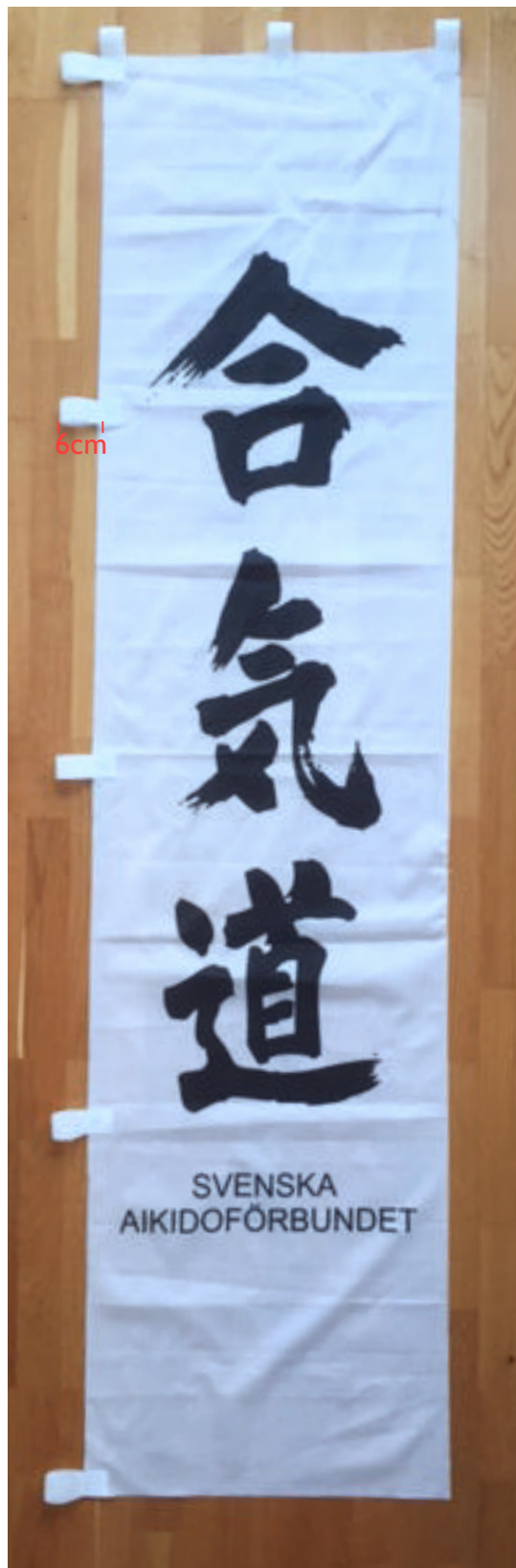
Flagga med hållor i överkant och sida: